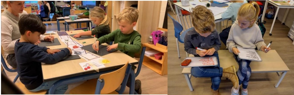
Kleine kring en interactie tijdens instructie

De midden- en bovenbouw zijn bewust aan het ontwikkelen aan een gedifferentieerde instructie met activerende werkvormen.